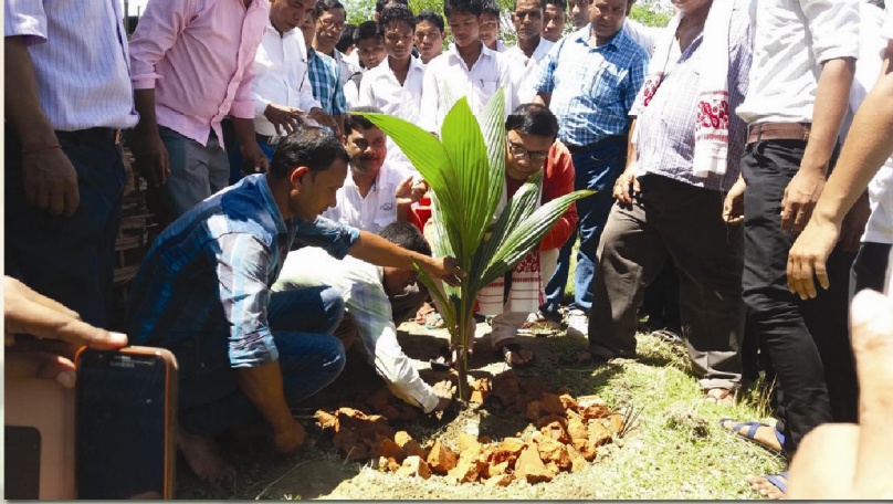
কলাবাৰী মহাবিদ্যালয়ৰ প্ৰাঙ্গনত বৃক্ষৰোপন কৰা মুহূৰ্তত বিধায়ক

গছ থাকিলেহে মানুহ জীয়াই থাকিব। কিন্তু দুখৰ বিষয় যে বিগত চৰকাৰবোৰৰ কাৰ্যকালত আমাৰ ৰাজ্যখনৰ বনাঞ্চলসমূহ এফালৰ পৰা ধ্বংস কৰা হ'ল। ফলস্বৰূপে আমাৰ ৰাজ্যখনৰ বতৰ আৰু উত্তাপত সাংঘাতিক ধৰণে পৰিৱৰ্তন হোৱা পৰিলক্ষিত হৈছে। আমাৰ চৰকাৰ ক্ষমতালৈ আহিয়েই পঞ্চায়ত আৰু গ্রামোন্নয়ন বিভাগৰ অধীনত এনৰেগা আঁচনিৰ জৰিয়তে সমগ্ৰ ৰাজ্যখনক সামৰি বৃক্ষৰোপন কাৰ্যসূচী ৰূপায়ন কৰা হৈছিল। আমিও আমাৰ সমষ্টিৰ প্ৰতিখন পঞ্চায়ততে এনৰেগা আঁচনিৰ জৰিয়তে বৃক্ষৰোপন কৰিছোঁ। লগতে গছপুলিসমূহ জীৱ-জন্তুৱে নষ্ট কৰিব নোৱাৰাকৈ সংৰক্ষিত কৰাৰ ব্যৱস্থা গ্ৰহণ কৰা হৈছে।