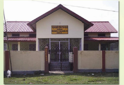
ৰাঙলীয়াল ডাক বঙলা