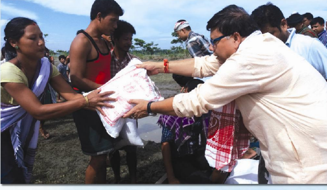
বানপানীৰ সাহায্য বিতৰণ কৰা অৱস্থাত বিধায়ক