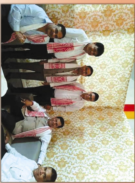
টোটা শিক্ষক সকলৰ মাজত নিযুক্তি পত্ৰ বিতৰণ কৰা অনুষ্ঠানৰ পাছত মাননীয় মুখ্যমন্ত্ৰী আৰু মাননীয় শিক্ষামন্ত্ৰী মহোদয়ৰ লগত বার্তালাপত বিধায়ক।