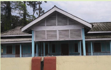
হাৰাজান ডাক বঙলা

(ক) প্ৰায় ৭০ লক্ষ টকা ব্যয় কৰি দীৰ্ঘদিন ধৰি জৰাজীৰ্ণ অৱস্থাত পৰিত্যক্ত হৈ থকা ক্ৰমে হাৰাজান, কলাবাৰী, ৰাঙলীয়াল স্থিত গড়কাপ্তানী ডাক বঙলা তিনিটা মেৰামতি ও নিৰ্মাণ কৰি উলিওৱা হয়।