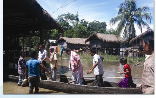
মিছিং অধুসিত এলেকাত বানপানী পৰিদৰ্শন কৰা অৱস্থাত বিধায়ক