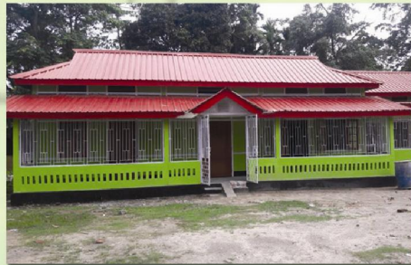
কলাবাৰী ডাক বঙলা